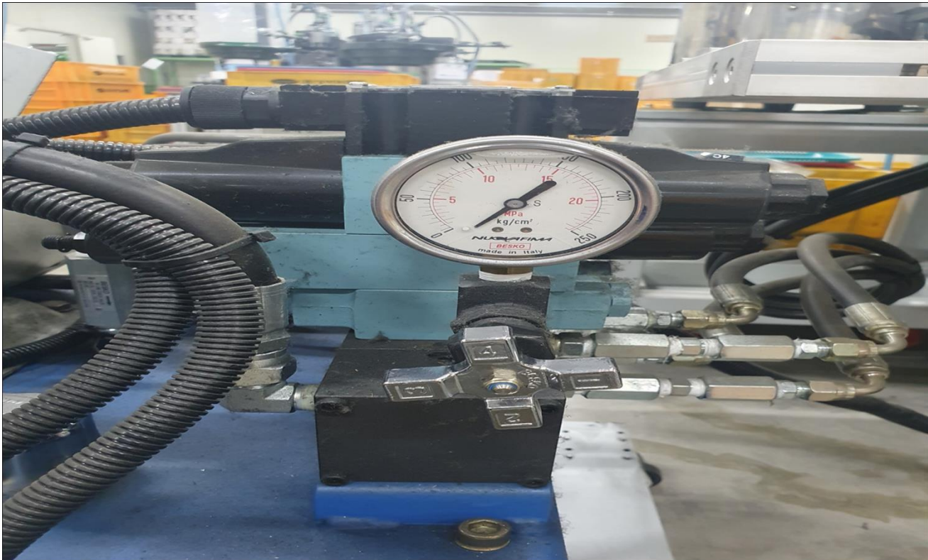
압력게이지가 올라가지 않음